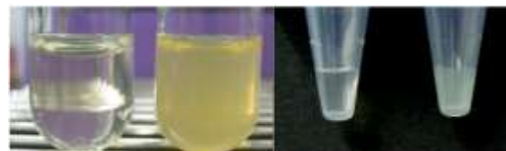
乳ビ検体の色見本は 1,000 ホルマジン濁度